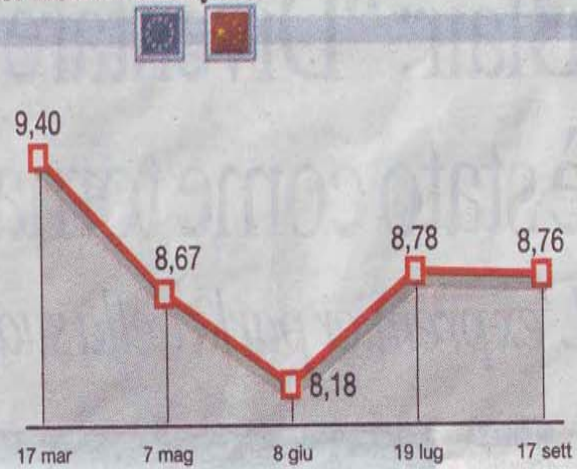
Sei mesi di euro-yuan