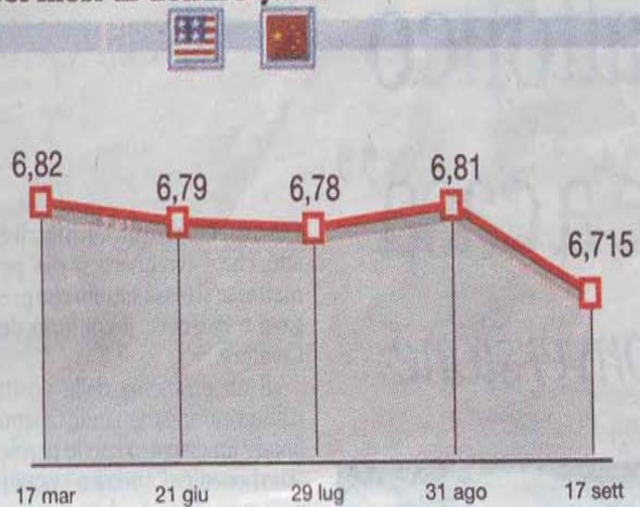
Sei mesi di dollaro-yuan