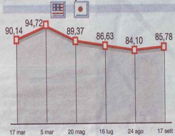
Sei mesi di dollaro-yen