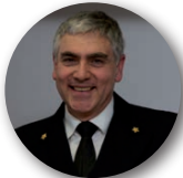
Contrammiraglio Luigi Giardino

Comando Generale Capitanerie di Porto Capo Dipartimento Sicurezza della Navigazione