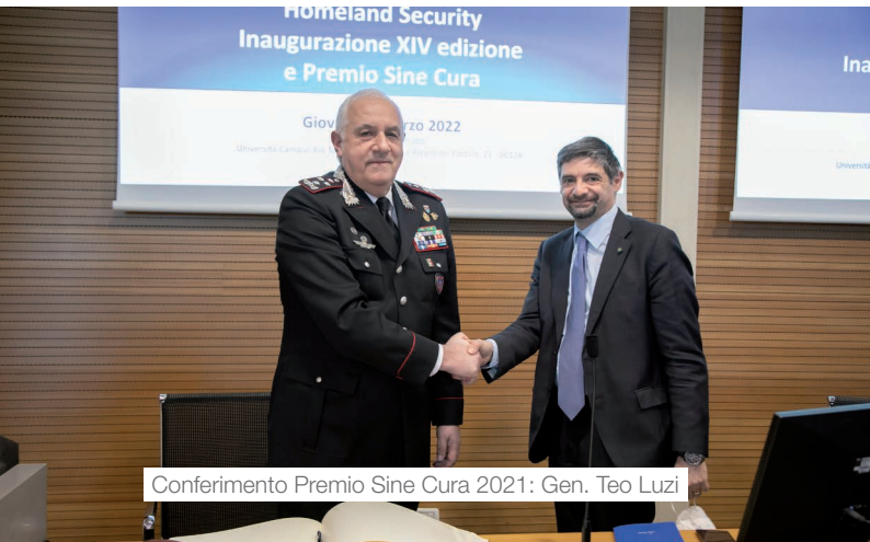
Conferimento Premio Sine Cura 2021: Gen. Teo Luzi