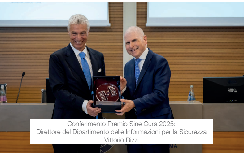
Conferimento Premio Sine Cura 2025: Direttore del Dipartimento delle Informazioni per la Sicurezza Vittorio Rizzi