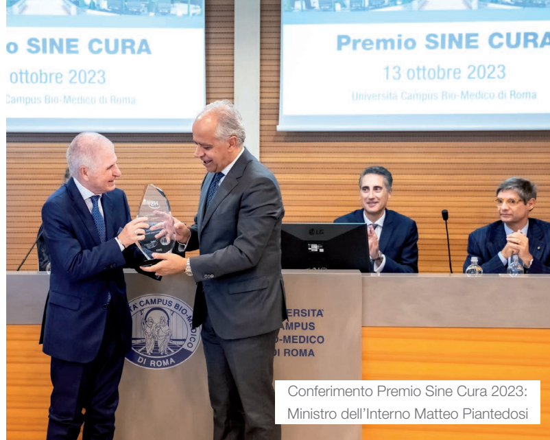
Conferimento Premio Sine Cura 2023: Ministro dell'Interno Matteo Piantedosi

Per i professionisti già occupati nel settore della sicurezza, il Master offre l'opportunità per arricchire il proprio Curriculum, ampliare il network di conoscenze in un settore in grande espansione e l'occasione per una crescita lavorativa e un avanzamento di carriera.