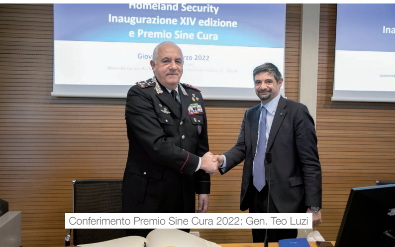
Conferimento Premio Sine Cura 2022: Gen. Teo Luzi